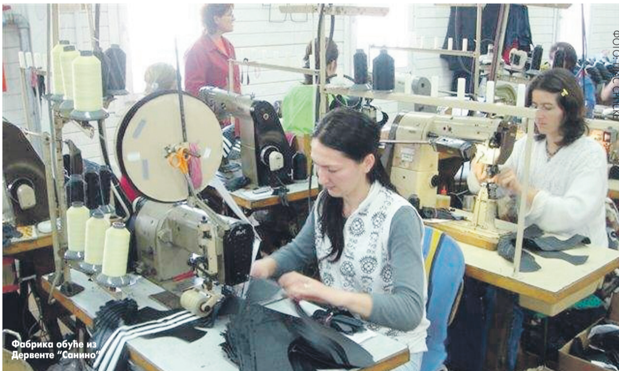
Фабрика обуће из Дервенте "Санино"

Сребрну плакету заслужила Самостална занатска радња "Маркиза" из Модриче, а бронзану Удружење ампутираца чији су чланови изложили више од 120 предмета из кућне ради-